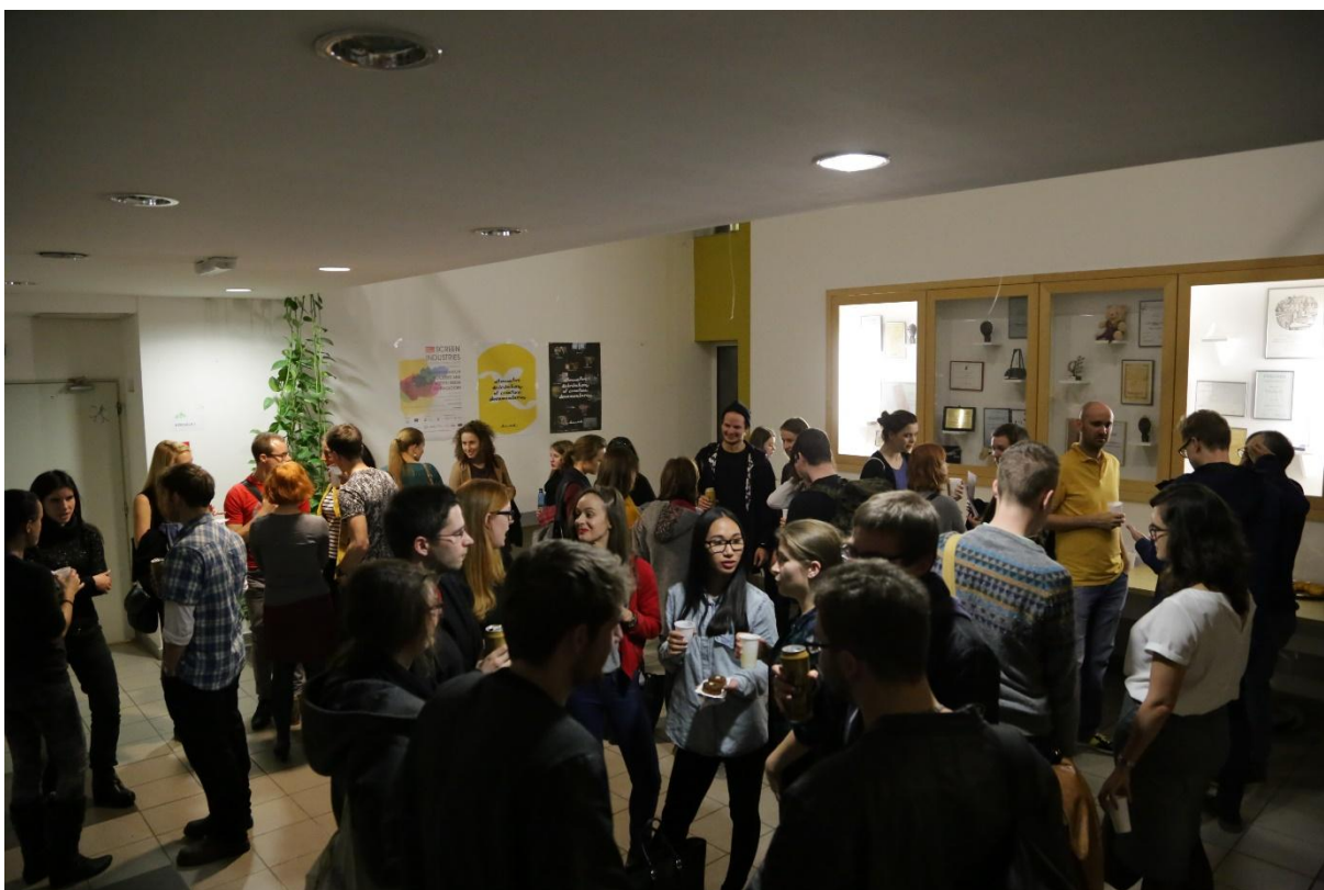
Recepcia po predkonferenčnom programe.