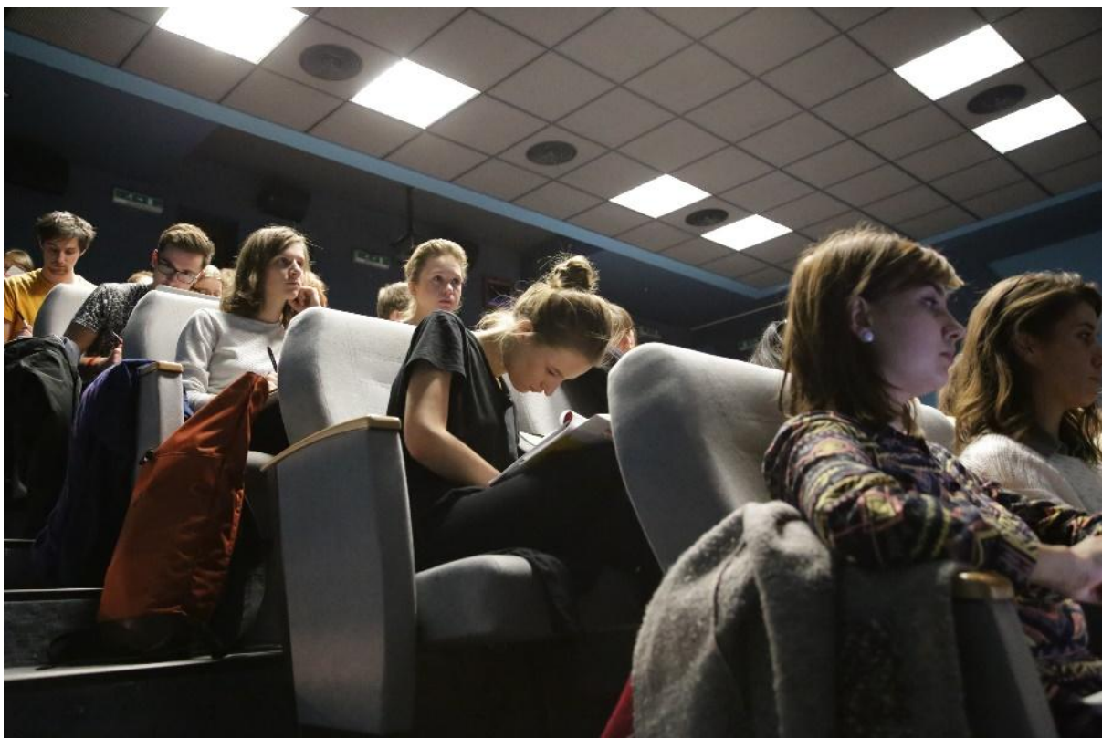
Konferenčné publikum počas panelovej diskusie Digitalizácia a alternatívne formy distribúcie v audiovizíi.